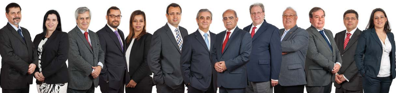
Primeira reunião da Direção