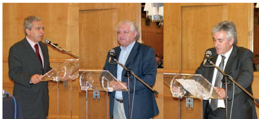
Os presidentes do SISEP, do STAS e do SBC, unânimes na defesa do sindicato único

"Obrigado por acreditarem em nós e nos fazerem sentir que a nossa responsabilidade é ainda maior do que antes – isso quer dizer que a nossa obra continua a ser muito importante para os bancários, para a democracia e para a sociedade portuguesa", concluiu. ■