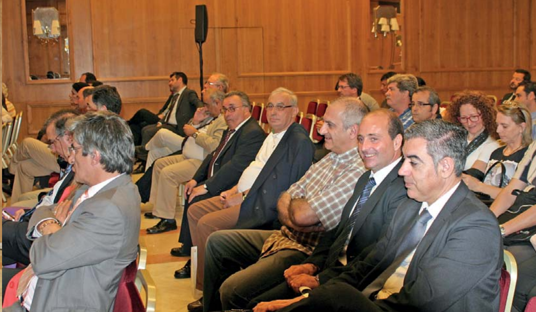
Os Secretariados Regionais e de Empresa também tomaram posse