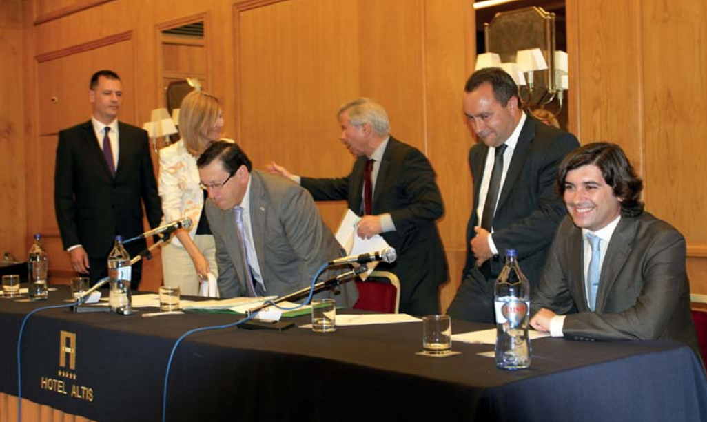
A troca de lugares na Mecodec