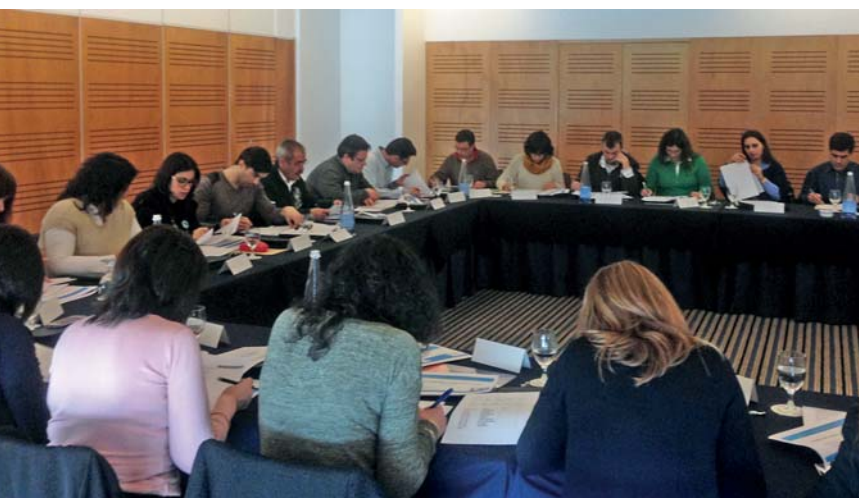
Ação em Ponta Delgada