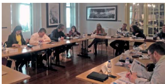
Formação em Lisboa

Revestiram-se de assinalável êxito e elevada participação os três últimos cursos do primeiro trimestre do ano, que decorreram em Lisboa, Évora e Ponta Delgada