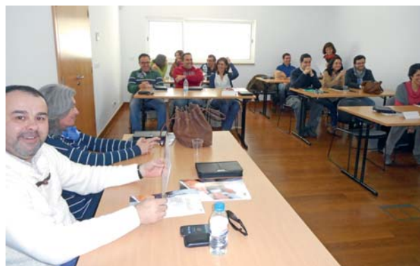
Curso em Évora