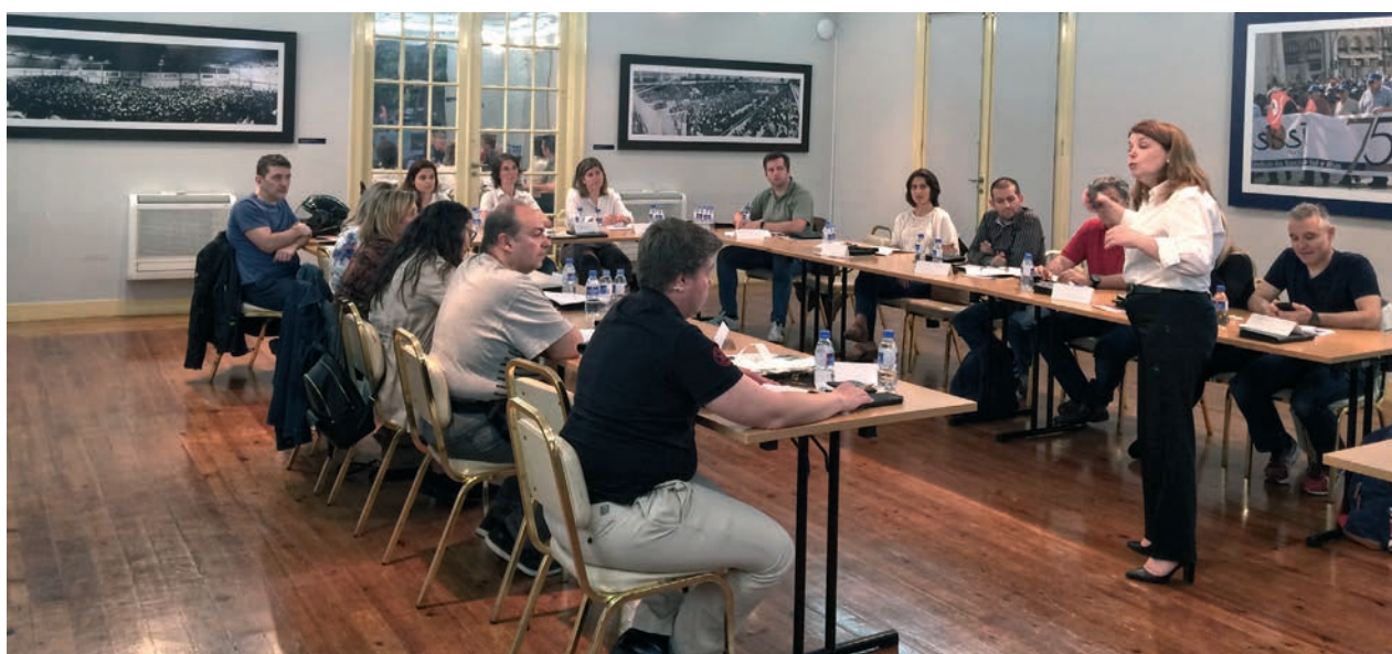
Ação sobre insolvência, que será agora repetida

Comunicação com o cliente é mais um curso que se pretende realizar e destina-se preferencialmente aos bancários que contactam diretamente com os clientes.