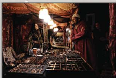
"Noites d'encanto I" Jorge Araújo