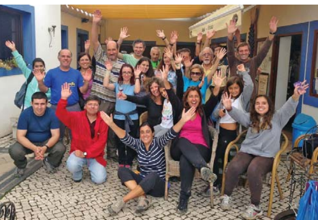
... e o descanso dos caminhantes

A chuva que caiu previamente deixou um brilho próprio na vegetação que rodeava a zona, mas também ajudou a formar terreno lamacento. Decorrente disso, foi com naturalidade que a caminhada foi sendo feita a passo de caracol, não fosse o pé escorregar por onde não devia e obrigar a aterragens forçadas.