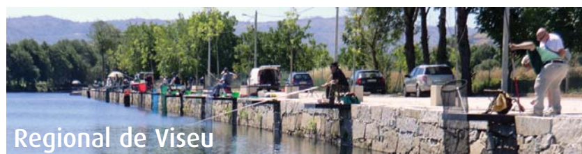
Regional de Viseu

Os dois primeiros classificados representarão o SBC na final nacional, que se disputará em 2015. ■