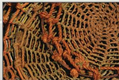
"Artes de pesca" Emanuel Pontes