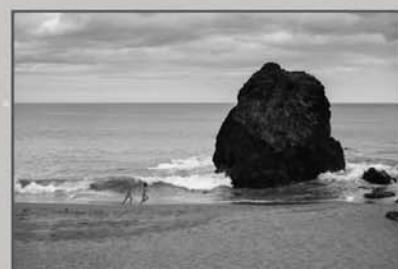
"Felicidade..." Paulo Jorge