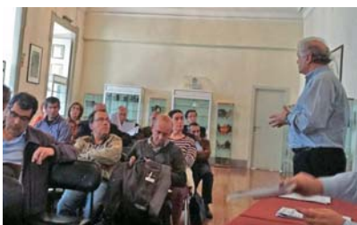
Uma das anteriores sessões do Conselho Geral

A reunião ordinária semestral do Conselho Geral terá lugar no próximo dia 27 de novembro