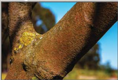
"Texturas" Aires Pereira