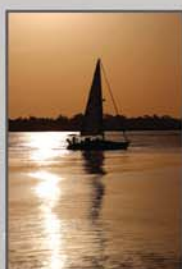
"Amanhecer no Guadiana" Jorge Araújo