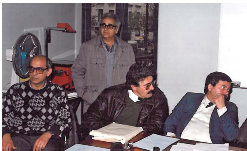
As primeiras eleições