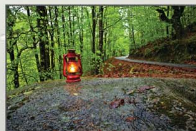
"Gerês iluminado" José Canelas