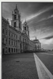
"Linhas memoriais" Francisco Oliveira