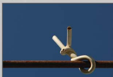
"Caracol" Emanuel Pontes