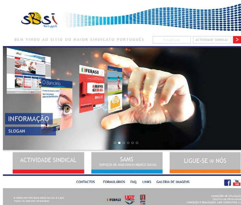
Uma das imagens da nova primeira página

Clicando numa dessas áreas, o utilizador entra no menu respetivo, onde en-