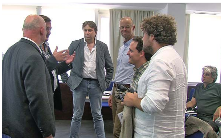
Os oradores em conversa com o secretário-geral da UGT

Por último, Schulten referiu que a Alemanha, contrariando a tendência europeia, está a tentar reforçar o uso de Portarias de Extensão, de forma a que a negociação coletiva abranja o maior número possível de trabalhadores.