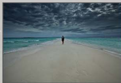
"Tempestade à vista" José Canelas