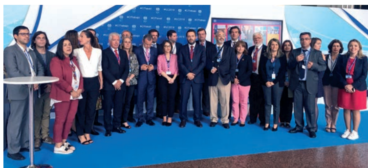
Parte da delegação portuguesa presente em Genebra