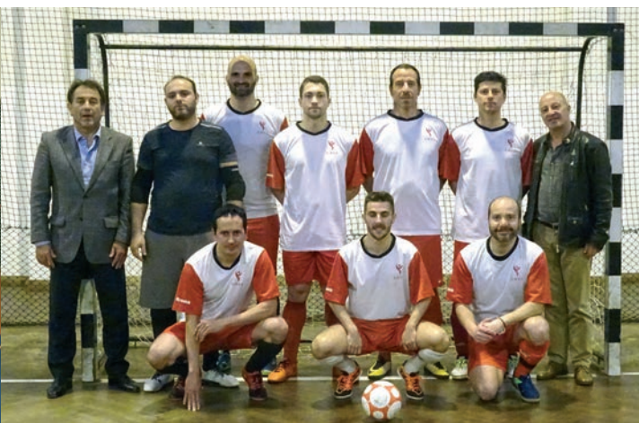
GD Santander Totta arrecadou o bronze