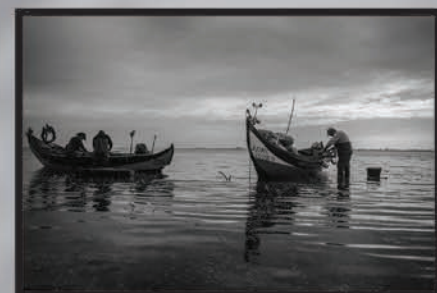
"Amanhecer na faina" Francisco Oliveira