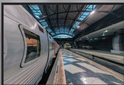
"Linhas" Orlando Viegas