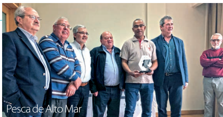
Pesca de Alto Mar