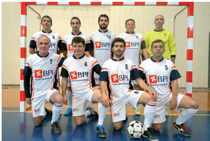
Os Mesmos deram luta até ao final e ficaram honrosamente no segundo lugar