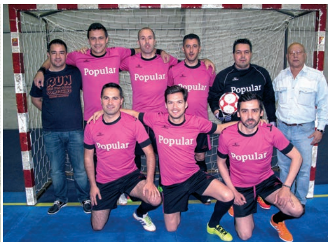
A equipa Ventus Popularitas

O resultado final foi de 10-9, favorável à equipa do SBSI, que assim revalidou o título. ▶