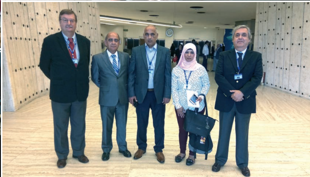
A delegação da UGT com os representantes da Palestina